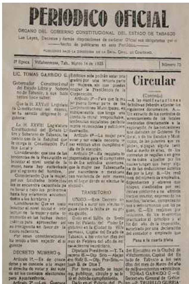
PUBLICADAS EN EL PERIODICO OFICIAL ORGANO DE GOBIERNO CONSTITUCIONAL DEL ESTADO DE TABASCO NUMERO 75 DE FECHA 14 DE MARZO DE 1925